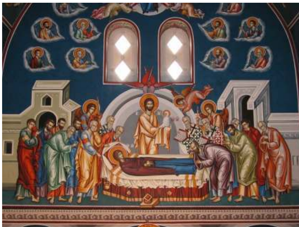
DORMITION OF THE MOST HOLY THEOTOKOS

404 Meredith Rd. N.E. Calgary, AB T2E 5A6